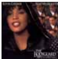
OST / Pop

Sie gehört zu den bedeutendsten Popsängerinnen unserer Zeit und zu den erfolgreichsten. In ihrem Haus zieren alleine sechs Grammys die Wände, davon schon zwei für den Song, der bei diesem Soundtrack als erstes zu hören ist, die Traum-Ballade für alle Verliebte: „I Will Always Love You“! Fünf weitere Songs folgen von ihr auf Seite 1 von „Bodyguard“, während Seite 2 weitere Stars der 90er Jahre folgen lässt: Kenny G und Aaron Neville, Lisa Stansfield, The S.O.U.L. S.Y.S.T.E.M., Curtis Stigers, Joe Cocker sowie die Orchester-Titelmelodie von „Bodyguard“, nach einer Komposition von Alan Silvestri. Ihr Filmdebüt, einer Romanze mit Kevin Costner, war ein voller Erfolg in jeder Hinsicht. Denn auch der Soundtrack war lange Zeit Nummer 1 der Charts, vom Grammy für das Album Of The Year ganz abgesehen. Sichern Sie sich Ihr Exemplar, solange es noch erhältlich ist.