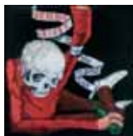
Rock / Pop

Um es gleich mal vorweg zu nehmen: „The Stand Ins“ macht richtig Laune und ist insgesamt ein sehr fröhlich gestimmtes Album. Okkervil River sind natürlich keine Unbekannten mehr, ihr letztes Album „Black Sheep Boy“ hat bereits viele Musikfreunde begeistert, die auch klassischen Rock und Pop mögen.