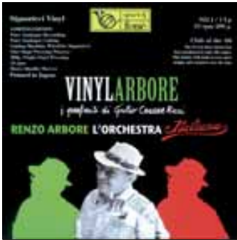
Renzo Arbore & sein Orchester

Label: Fone, Signorizzi Vinyl auf 496 Stück limitierte Pressung Pure Analogue Recording Pure Analogue Cutting One-Stage Pressing Process Heavy Quality Innenhüllen