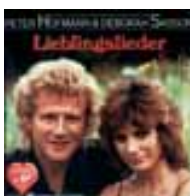
Deutsch / Klassik

Eine Benefizschallplatte aus dem Jahre 1984 zugunsten der Berliner Herzliga, für Musikfreunde heute eine schöne Überraschung und aufgrund des attraktiven Preises auch besonders lohnenswert! Zu hören sind Stücke, die der berühmte Opernsänger Peter Hofmann und die ebenfalls sehr bekannte US-Opernsängerin Deborah Sasson zusammen einspielten. Darunter „Ivory Man“, „Scarborough Fair“, „The Sun Ain't Gonna Shine Anymore“, „Let It Be“ und „Bridge Over Trouble Water“, aber auch Arien aus Wagners „Lohengrin“ und „Walküre“, Puccini „La Boheme“ und „Madame Butterfly“ sowie „La Traviata“ von Verdi. Der LP liegt das original Journal der Berliner Herzliga bei, die LP ist eingeschweißt.