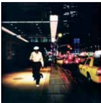
Aufnahmen 1. Juli 1998 in der Carnegie Hall in New York, USA.