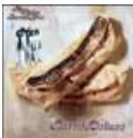
Country / Rock

Was zunächst nur wie ein „audiophiles“ Best Of-Album klingt, ist tatsächlich ein Reissue des zweiten Werkes der Flying Burrito Brothers, das 1970 erstmals erschien. Und es zählt neben dem Debütalbum, zum Besten, was Gram Parsons, Chris Hillman & Co. je auf ein Master gebannt haben. Es zeigt perfekt, wie man Rock und Country verbinden