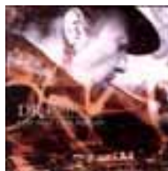
Blues / Rock