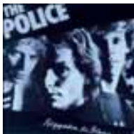
Rock / Pop

Erstveröffentlichung Oktober 1979. Wer diese Platte noch nicht im Schrank stehen hat, sollte sich in die Ecke stellen und schämen oder ganz einfach dieses Reissue im Rahmen der „Back To Black“-Reihe von Universal erwerben, solange es niemanden auffällt! Denn an dieser LP kann man eigentlich nicht vorbeigehen, für „Regatta De Blanc“ haben Sting, Andy Summers und Stewart Copeland zurecht ihren ersten Grammy erhalten. Der Grund waren natürlich die großartigen Hitsingles „Message In A Bottle“, „Walking on The Moon“ und der Titelsong „Regatta De Blanc“, im Besonderen aber die unglaubliche Wirkung der Musik, einer Mischung aus Rock, Reggae und New Wave. Bis heute haben die zeitlos wirkenden Songs nichts von ihrem Reiz verloren, jeder kennt sie und mag sie, The Police gehören zu den besten Rockbands der Postpunk-Ära der späten 70er bis Mitte der 80er. Um so mehr freuen wir uns über dieses Reissue mit grandioser Popmusik. Inklusive MP3-Code.