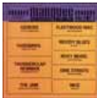
Pop / Rock

Die Anzahl von Collection-LPs ist so unüberschaubar, dass sie kein Archiv der Welt wirklich erfassen kann. Und viele Musikfreunde schätzen sie nicht besonders, die Zusammenstellungen wirken meist wie eine Drittverwertung und erneutes kommerzielles Ausschachten. Anders ist es aber dann, wenn man in unserem neuen Jahrtausend eine Platte bekommt, die eine richtig tolle Liste an Songs aufweist, ohne billige Lückenfüller. So ist es bei dieser spanischen Pressung: zu hören sind Genesis, Yardbirds, Thunderclap Newman, The Jam, Fleetwood Mac, Moody Blues, Roxy Music, Dire Straits und Nice! Noch Fragen?