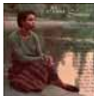
Jazz / Folk

Es gibt zum Glück mittlerweile schon eine ganze Reihe von Wiederauflagen toller Nina Simone-LPs. Wer aber diese legendäre Sängerin grundsätzlich kennenlernen möchte, der ist mit „The Legendary First Recording In New York City, 1957“ bestens bedient. Nicht nur wegen der beiden berühmten Stücke „I Loves You Porgy“ und „My Baby Just Cares For Me“ ist diese Platte ein musikalisches Sahnestück. Ein Spiritual wie „He's Got The Whole World In His Hands“ macht deutlich, warum diese Frau eine so unglaubliche Ausstrahlung besitzt; eine Ballade wie „Little Girl Blue“ lässt Steine erweichen. Trotz altersbedingter Schwächen bei harten Pianoanschlägen überrascht diese Aufnahme aus dem Jahre 1957 mit einem sehr angenehmen, perlenden Klangbild, was perfekt zu dieser grandiosen Musik passt!